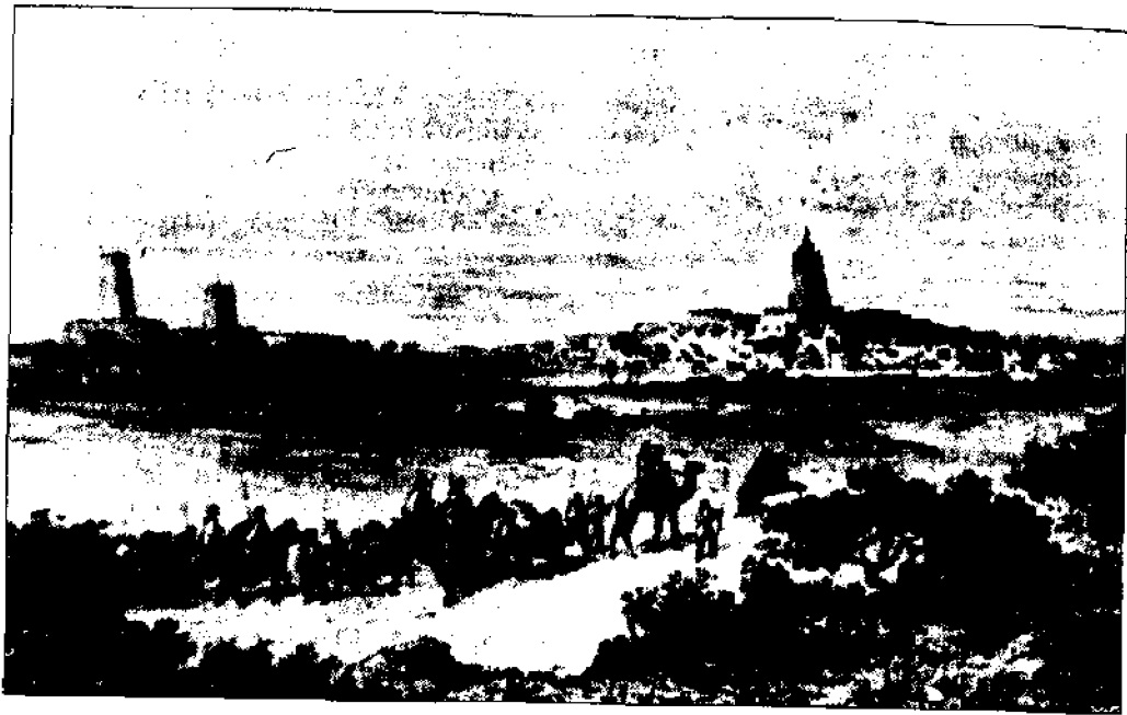
Город Томбукту (современный Мали) — крупный торговый центр сХв Гравюра XVIII в.